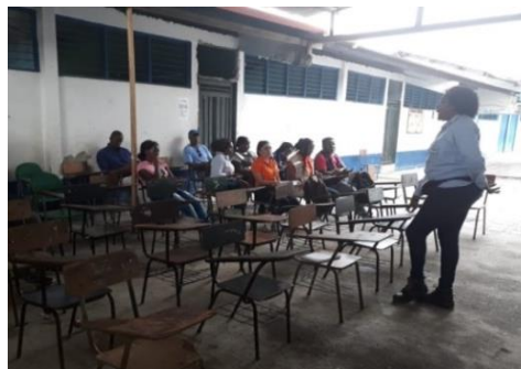
Socialización de información a la comunidad del barrio Niño Jesús sector la T y Palenque.