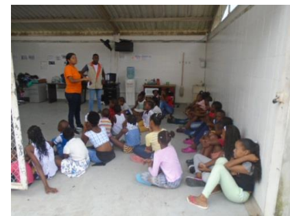
Jornada educativa con los niños del Club Defensor del Medio Ambiente de Ciudadela MIA bloque A