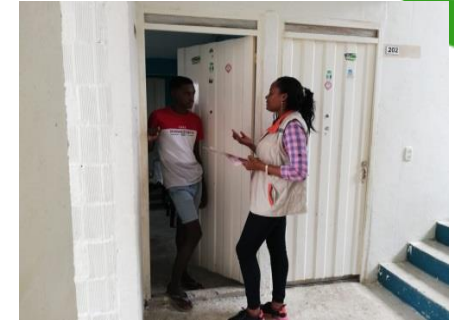
Sensibilización a habitantes Ciudadela MIA bloque B

Seis (6) secciones de llamadas telefónicas, distribuidas de la siguiente manera: una (1) para socializar información a los habitantes del barrio Jardín sector la 19b sobre levantamiento de información, para el día siguiente, una (1) para confirmar asistencia de los habitantes del barrio Santo Domingo sector casas fiscales, para que participen en reunión comunitaria, una (1) para reconfirmar asistencia a reunión de los habitantes del barrio Santo Domingo sector casas fiscales y tres (3) para actualizar base de datos de los niños que pertenecen a los Clubes Defensores del Medio Ambiente de Ciudadela MIA.