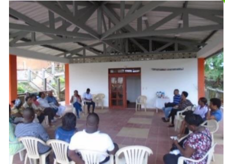
Reunión con los docentes coordinadores de los Clubes Defensores del Agua..

Una (1) participación en capacitación sobre alcantarillado simplificado organizado por el Fondo para el desarrollo Todos Somos Pazcífico.