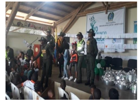
Participación en jornada de pintura, con niños y niñas de los sectores vulnerables de la ciudad de Quibdó.