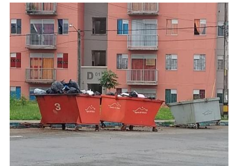
Registro fotográfico para seguimiento a contenedores de Ciudadela MIA.