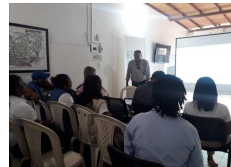
Participación en capacitación sobre alcantarillado simplificado.