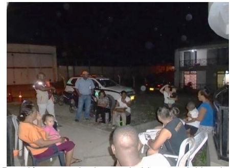
Reunión comunitaria con habitantes del barrio Santo Domingo sector Casas Fiscales