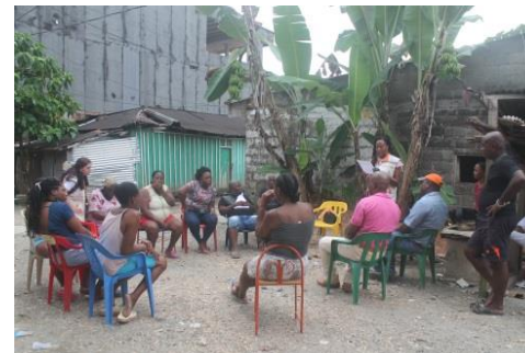
Reunión con habitantes del barrio Kennedy sector la Bombita.