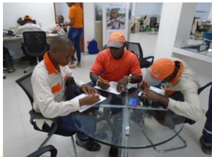
Aplicación de encuesta al personal de aseo y recolección.

Una (1) jornada de legalización de usuarios al servicio de acueducto, en el del barrio Kennedy sector La Bombita.