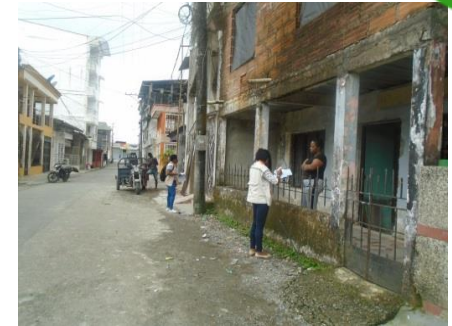
Levantamiento de información para la vinculación de clientes a los servicios de aseo y acueducto

Dos (2) jornadas de elaboración de formatos de encuestas: una (1) para identificar la percepción del personal de aseo y recolección, sobre la posibilidad de recibir hidratación en su jornada laboral y una (1) para identificar la percepción de los usuarios del barrio San Vicente sector la 5ta, con relación a la prestación del servicio de aseo.