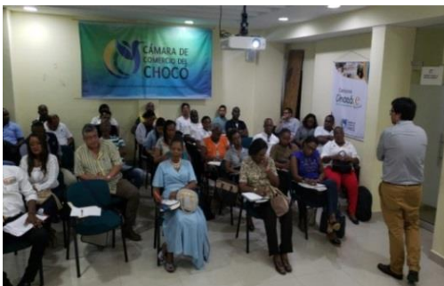
Participación en el taller #3 para formulación de Política Pública de Desarrollo Económico de Quibdó.

Una (1) participación en el taller N° 3, para formulación de Política Pública de Desarrollo Económico de Quibdó.