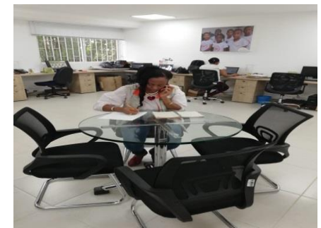
Realización de llamadas telefónicas para socializar información.