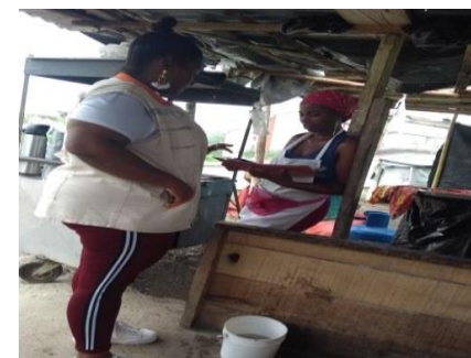
Sensibilización a vendedores ambulantes de Ciudadela MIA.