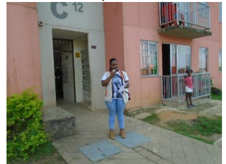
Perifoneo en todos los bloques de Ciudadela MIA, para informarles a los habitantes la fecha límite de pago con recargo