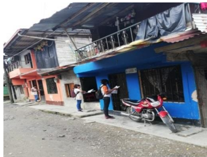
Aplicación de encuesta a usuarios del barrio San Vicente sector la 5ta.