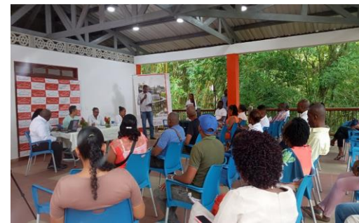
Apoyo al proceso de comunicación en el evento de rendición de cuentas