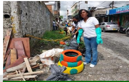
Participación en jornada de embellecimiento en el barrio Cesar Conto