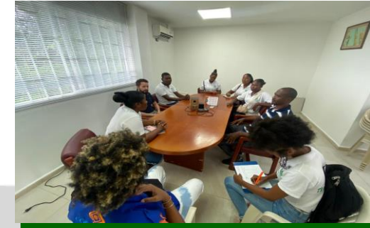
Participación en reunión con líder comunitario del barrio la Cascorba, U.T.CH y CODECHOCO