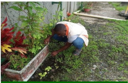
Apoyo a gestión ambiental en el embellecimiento y mantenimiento de zonas verdes en planta Playita

Apoyo a gestión cartera, mediante la sensibilización a usuarios de Ciudadela MIA, a través de perifoneo sobre cultura de pago y fecha límite de pago de la factura del mes de octubre con recargo.