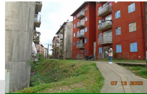
Apoyo a gestión cartera, mediante sensibilización a usuarios de Ciudadela MIA