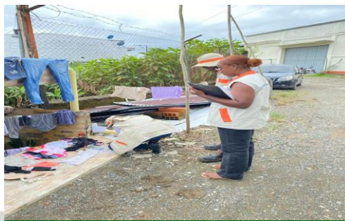
Apoyo a optimización en la suspensión de usuarios con desviación significativa