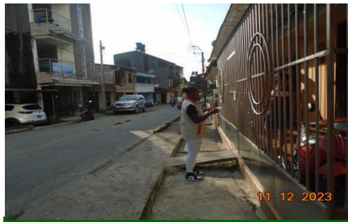
Sensibilización a habitantes del barrio Niño Jesús, sobre uso racional y eficiente del agua

Participación en reunión con líder comunitario del barrio la Cascorba sector Bella Vista, practicantes de Trabajo social de la Universidad Tecnológica Chocó y CODECHOCO, para concertar actividad a realizar el domingo 17 de diciembre, estuvieron presentes diecisiete(17) personas.