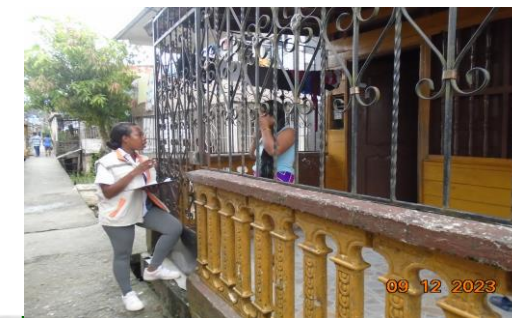
Sensibilización a habitantes del barrio Chambacú