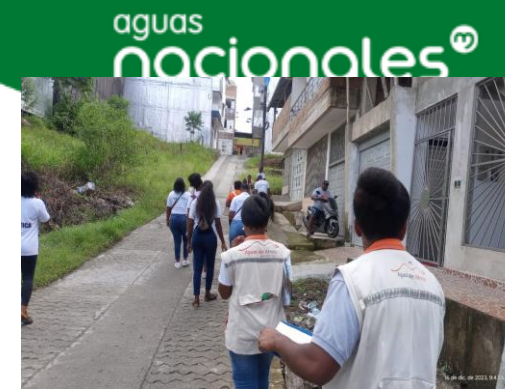
Participación en socialización de información a habitantes de la Cascorba sector Bella Vista

Apoyo a visita guiada con niños y niñas del grupo vacacional Mi gran taller, para socializarles el proceso de potabilización del agua desde su captación hasta su distribución, a través de la cual se contactaron doscientas siete (207) personas.