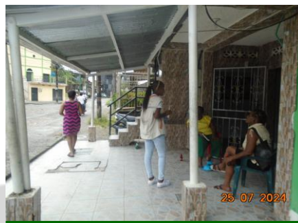
Apoyo al presidente de Acción Comunal del barrio Kennedy, mediante sensibilización sobre manejo adecuado de residuos sólidos