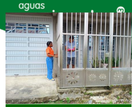
Apoyo a operación comercial en el levantamiento de información en Villa Contry

Apoyo a gestión cartera en diez (10) actividades, dos (2) jornadas de sensibilización a los habitantes de Ciudadela MIA, sobre cultura de pago y fecha límite de pago de la factura de los servicios de Acueducto, Alcantarillado y seo con y sin recargo.