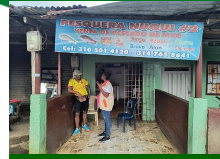
Apoyo al proceso de aseo, mediante sensibilización a habitantes del sector la 18

Tres (3) actividades con el proceso de redes de acueducto: Un recorrido en el barrio los Ángeles sector Condoto, para levantamiento de información diagnóstica sobre el servicio de acueducto, un recorrido en el barrio la Unión, para atención a requerimiento del presidente de la Junta de Acción Comunal, sobre fuga en el servicio de acueducto y una visita a predios del barrio Villa Sandra, para verificación si están en la base de datos de Aguas del Atrato.