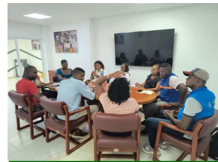
Participación en reunión interinstitucional, para concertación de intervención en punto crítico