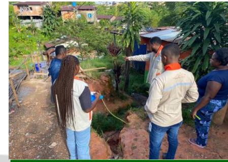
Apoyo al proceso de redes en la atención de requerimiento en el barrio la Unión