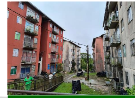
Apoyo a gestión cartera en sensibilización sobre cultura de pago