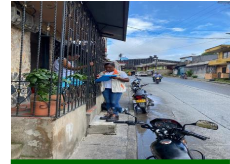
Apoyo a operación comercial en el levantamiento de información en el barrio San Francisco de Medrano