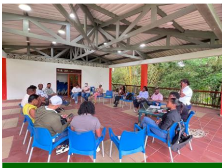
Apoyo a la líder comercial (e) mediante participación en reunión con presidentes de Acción Comunal de la comuna N° 1

Nueve (9) jornadas de sensibilización, sobre uso racional y eficiente del agua en los barrios y/o sectores: Silencio sector el Dorado y Carrera 10 entre calles 26 y 30, Carrera 9 entre calles 24 y 26 y sector Prado, Yesquita calles 20, 21, 22 y 23, Porvenir sectores el Triunfo, Colon y principal, San Judas sectores las Colinas y Chupa caña y Jardín sector los Lirios, mediante las cuales se contactó de manera directa a ochocientas ochenta y ocho (888) personas.