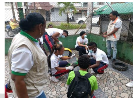
Participación en jornada de pintura de llantas