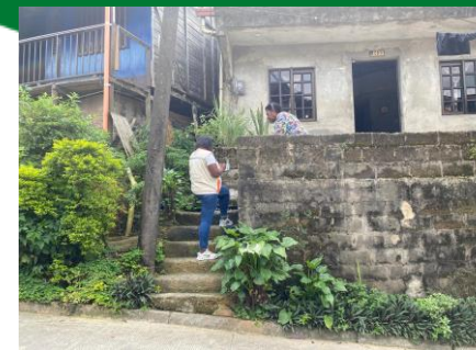
Sensibilización a habitantes del barrio el Bosque, sobre manejo adecuado de residuos