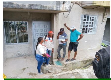
Apoyo al proceso de optimización en la revisión a usuario de Zona Minera - Girasoles