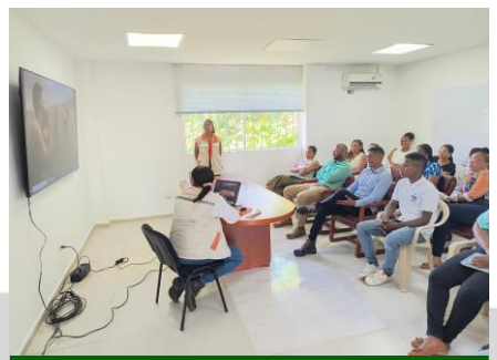
Apoyo a gestión ambiental en sensibilización a personal administrativo