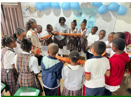
Jornada pedagógica con estudiantes del Armando Luna Roa

Participación en visita guiada a las plantas de potabilización con estudiantes del noveno semestre de Ingeniería Ambiental de la Universidad Tecnológica del Chocó “Diego Luis Córdoba” , el objetivo de socializarles el proceso de potabilización del agua, desde su captación, tratamiento y hasta la distribución, se contactaron treinta (30) personas.