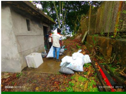
Apoyo a gestión ambiental en la caracterización de residuos sólidos