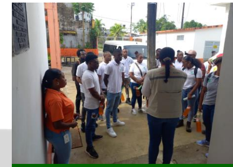
Participación en visita guiada a las plantas de potabilización