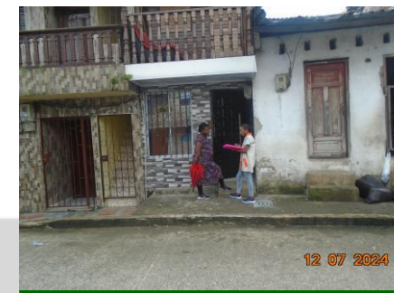
Sensibilización a habitante del Porvenir sobre uso racional y eficiente del agua