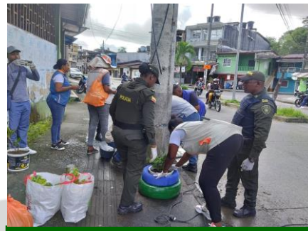
Participación en jornada de embellecimiento de punto crítico aledaño a la escuela Alameda